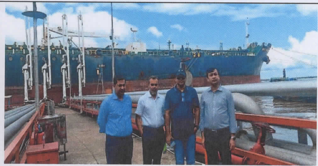
চিত্র-২: কমিটির সদস্য ও সদস্য-সচিব এমপিএল এর ডলফিন জেটি-৫ (DOJ-5) এ আমাদানিকৃত জ্বালানি তেল খালাস কার্যক্রম পরিদর্শন করেন।

৩। ২০২৩-২৪ অর্থবছরে বার্ষিক কর্মসম্পাদন চুক্তি অনুযায়ী অক্টোবর ২০২৩ সময়ে পরিশোধিত তেল আমদানির লক্ষ্যমাত্রা ও অর্জনের বিবরণ নিম্নরূপ: